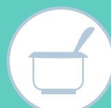
IOGURTES PARA AUMENTAR A IMUNIDADE