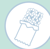
BARRAS DE CEREAIS