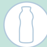
SHOTS DE BEBIDAS LÁCTEAS