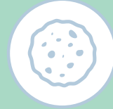
MONO PORÇÕES: BOLOS/BISCOITOS/ BISNAGUINHAS