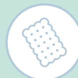
BISCOITOS E SNACKS SAUDÁVEIS