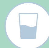
LEITE E ACHOCOLATADOS EM PÓ